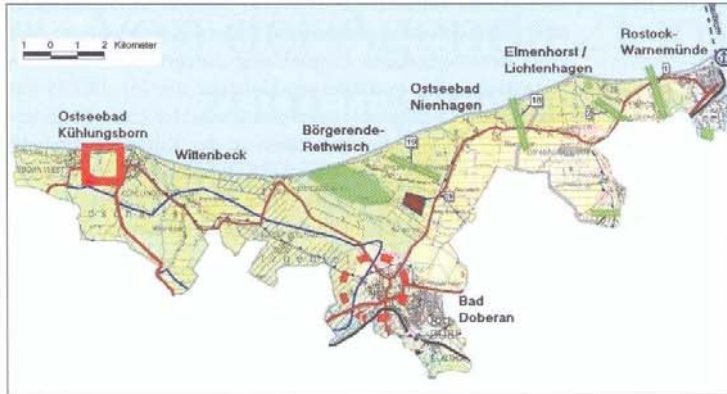
Abb.1: Die Projektregion Warnemünde-Kühlungsborn. The coastal area between the German Baltic seaside resorts Warnemünde and Kühlungsborn, which was considered in the coastal zone management project

geführt sowie Möglichkeiten zur Lösung der Nutzungskonflikte angedacht.