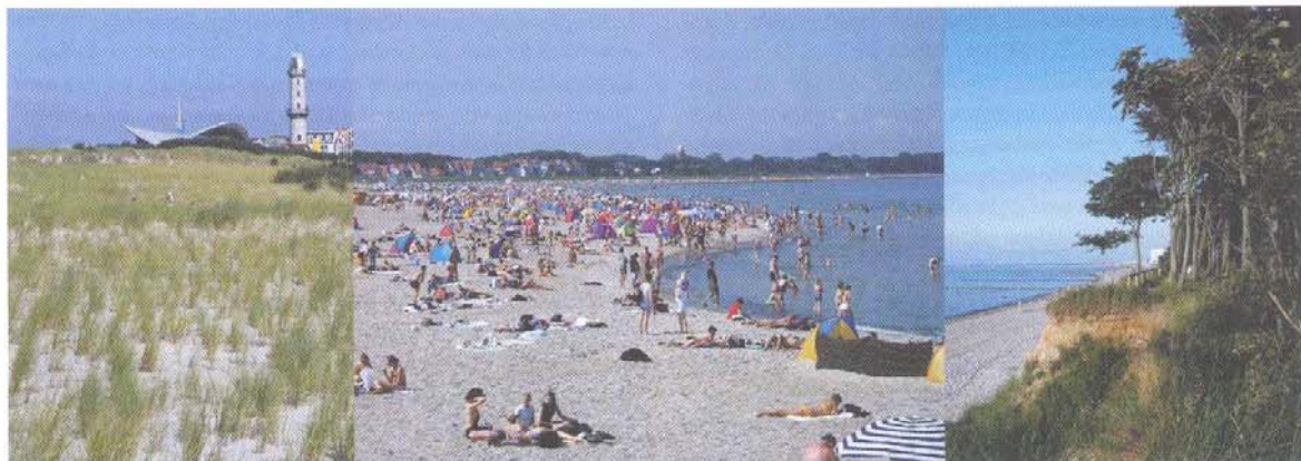
Abb. 2: Dünen, Strand und Steilküste von Warnemünde. Typical landscape near Warnemünde, characterised by coastal dunes, beach and cliffs.