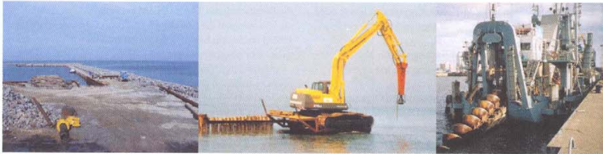
Abb. 3: Sportboothafenbau in Kühlungsborn, Bühnenbau in Warnemünde und Bagger im Rostocker Hafen.

Recent activities along the coast line. Sport boat harbours are built in many locations, like Kühlungsborn, and alter the natural sediment dynamics along the coast. Rows of piles, the so called „Bühnen“ are a common feature along the German Baltic coast and prevent the erosion of beaches. Due to the recent invasion of the mussel Teredo Narvalis these pile systems were damaged and have to be renewed. The dredging of shipping channels and dumping of these coastal sediments are other permanent activity along the coast.